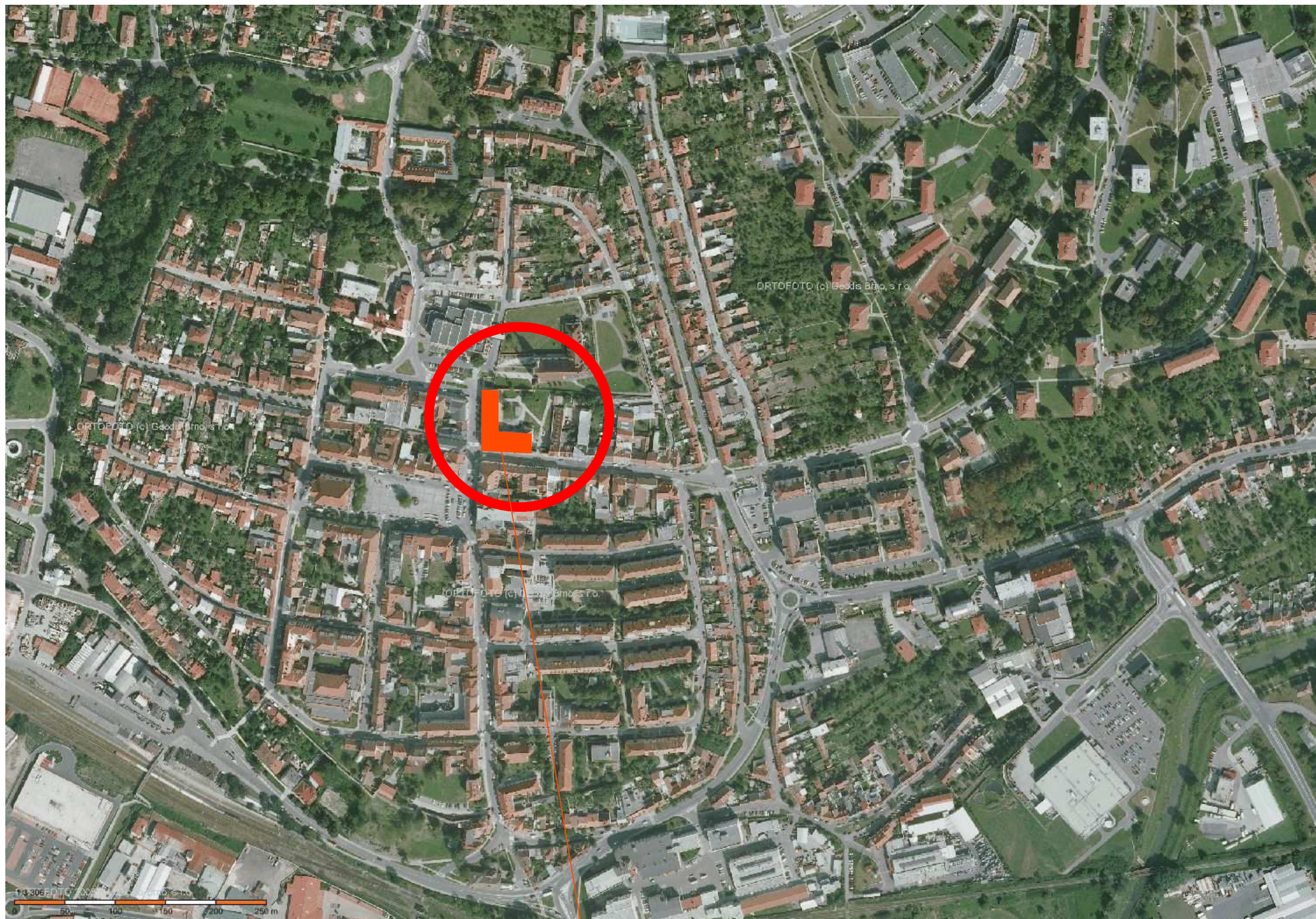
Panský dům - obřadní síň, knihovna, NZDM - klimatizace